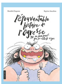
FR J FICTION CHAPERON (North Branch)