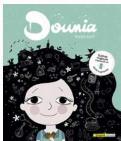
LIVRES D'IMAGES FR J FICTION ZARIF (North Branch)