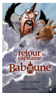
EMPLACEMENT D'ÉTAGÈRE EN ATTENTE (North Branch)

Les oeuvres du Prix Mélèze, pour les élèves de la 4ème à la 6ème année, abordent différentes thématiques, sous forme de petits romans d'un maximum de 100 pages, des albums ou des documentaires.