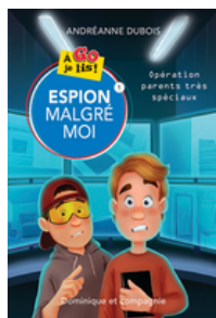
FR J FICTION DUBOIS (North Branch)